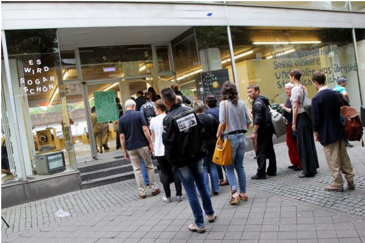
Abbildung 3: Die Eröffnung des Offspace in der Essener Innenstadt

beworben und an dem sie sich - mindestens teilweise - mit eigenen künstlerischen Projekten beteiligt haben. Dafür erhielten sie viel positives Feedback.