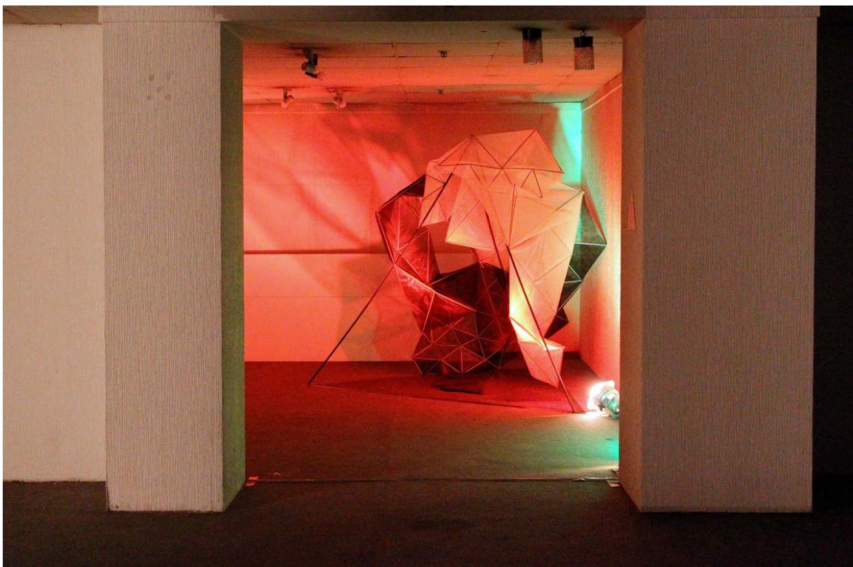
Abbildung 4: „Installation“