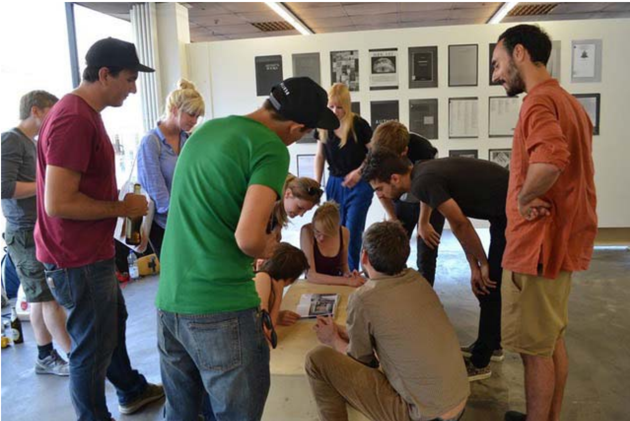
Abbildung 2: Besprechung und Auswahl künstlerischer Arbeiten im Team

Die Zusammenarbeit der Studierenden untereinander durchlief Phasen der Annäherung und Differenzierung über Krisen hin zur beinahe euphorisch erlebten intensiven Zusammenarbeit und Integration in der Schlussphase. Dabei ist es den Studierenden gelungen, ein ehemaliges und leerstehendes Kaufhaus in der Essener Nord-Stadt selbstständig in Betrieb zu nehmen und dort einen temporären Offspace für zahlreiche Begegnungen im Rahmen eines spartenübergreifenden künstlerischen Programms zu schaffen. Die Essener Nordstadt bzw. der Viehofer Platz gilt als ein besonders „verrufter Ort“ 9 in der Stadt. Die Besonderheiten des Ortes und sein städtisches Umfeld waren seitens der Studierenden Bestandteil der Überlegungen zur offenen Gestaltung und Nutzung des Raums als Offspace.